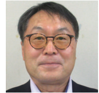
㊦ 大塚今沢、大塚新田 一杉 剛 ● (有)一杉印刷所