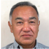
㊦ 一本松、桃里、植田 望月 芳彦 ● (有)望月塗装工業