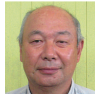
㊦ 浮島 成島 安司 ● (株)ナルシマ