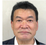
㊦ 原北 松本 三雄 ● 松新